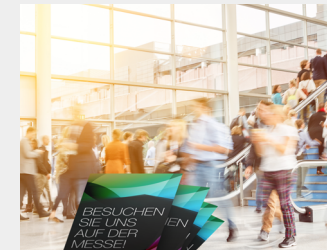
... als Streuartikel