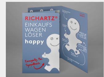
... mit Standardverpackung